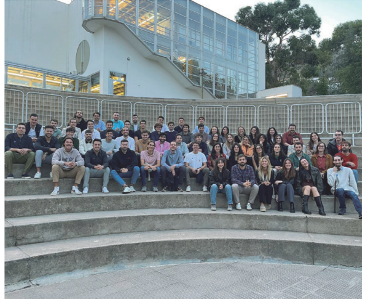
Trobada d'Alumni a Thau Barcelona, octubre 2023