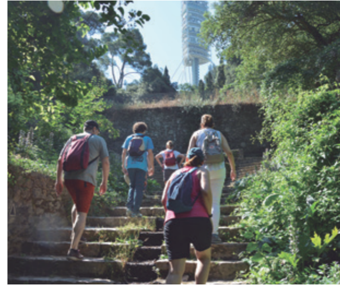
Sortida del claustre per fer la ruta verdagueriana, juliol 2019

I és que d'això va la proposta. Compartir una jornada d'aproximació a l'Art, la Història i el Paisatge que ens ofereixi un moment de celebració del curs que acaba i que ens inspire per al curs que començarà d'aquí dos mesos. Una oportunitat d'exaltar l'amistat i la col·laboració entre companys i companyes i promoure el benestar mutu. Una acció modesta que té un impacte molt positiu en el clima de l'escola. Si teniu propostes per al juliol del 2024, seran benvingudes.