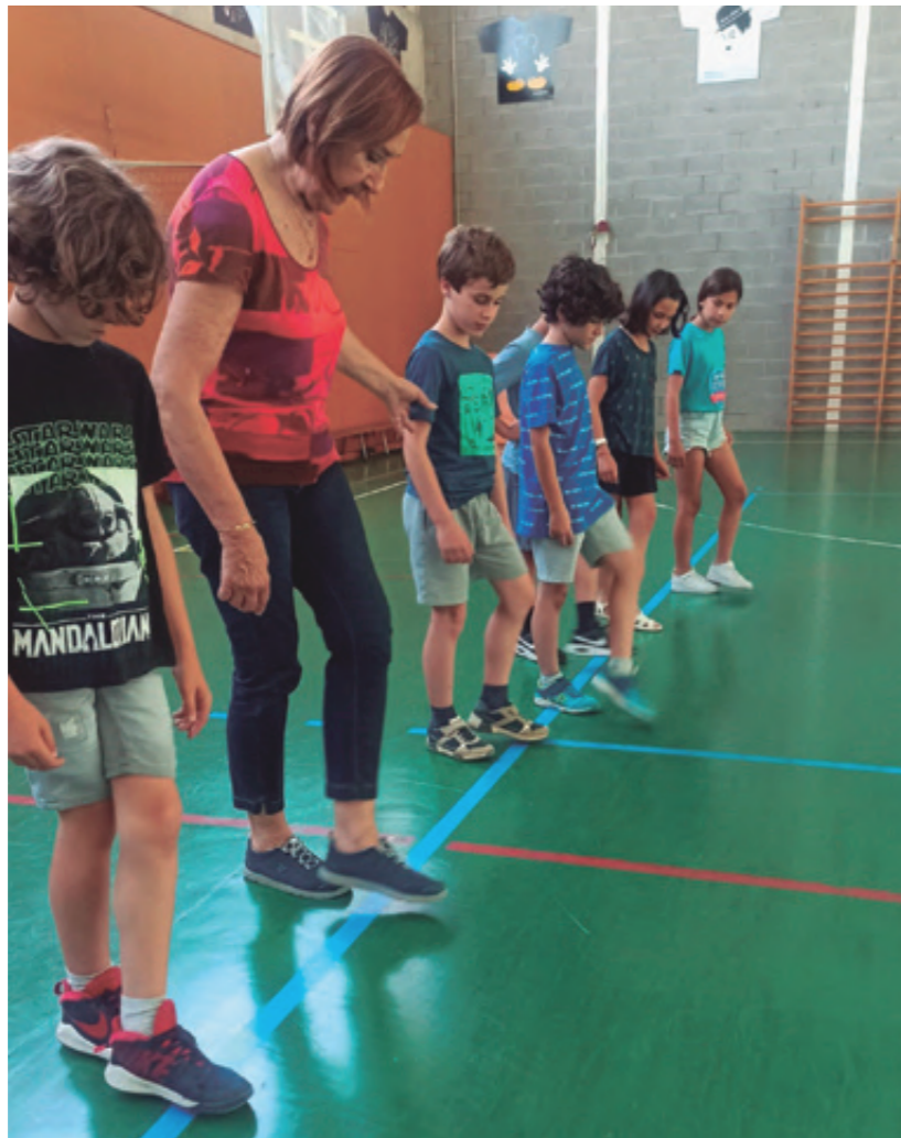
Taller de sardanes amb l'alumnat de 4t d'Educació Primària, maig 2022

cola i en la transmissió del nostre projecte educatiu a l'alumnat.