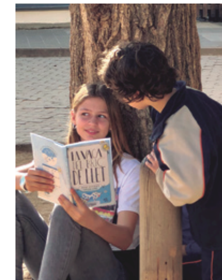
Activitat de treball entre iguals: "L'amic lector", març 2020

(entesa com el suport i recursos socials, habilitats interpersonals, fortalesa intrapersonal) com comunitària (autoestima col·lectiva, identitat cultural, relacions positives, sentiment de pertinença).