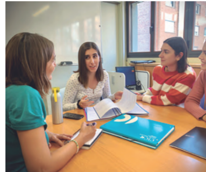
Professores amb mentora, octubre 2023

Un tret característic de qualsevol docent competent és l'interès per l'aprenentatge