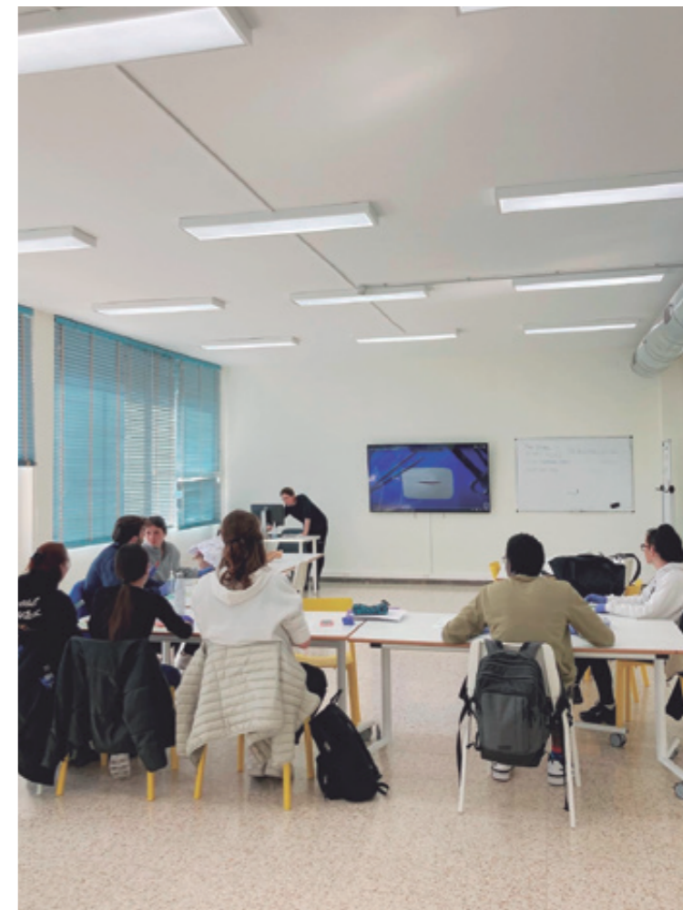
Alumnat de CAI (Cures Auxiliars d'Infermeria), en una classe magistral de sutures, curs 2022-2023

En definitiva, treballem junts per esdevenir un claustre comprensiu i inspirador per als nostres alumnes.