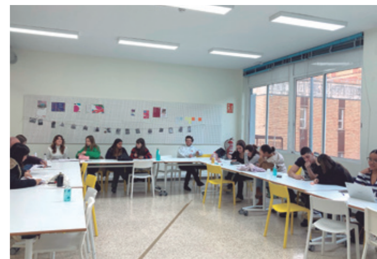
Alumnat d'IS (Integració Social), durant la sessió de treball autònom del mòdul de Projecte, curs 2022-2023