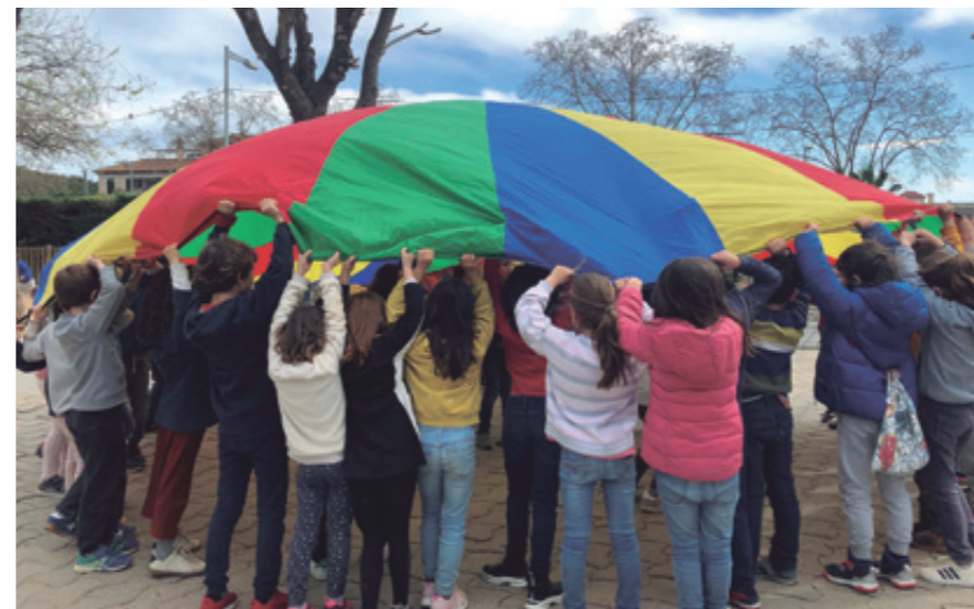
Dinàmica de joc cooperatiu al pati, febrer 2020

Cal remarcar un altre aspecte que destaquen aquests estudis, que és la importància de fomentar la resiliència (també anomenada "paradigma del desafiament") als centres educatius, tant personal