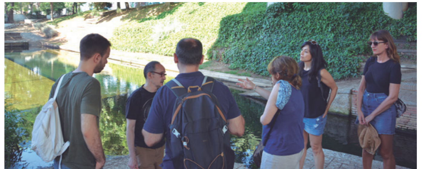
Sortida del claustre al Rec Comtal, juliol 2022