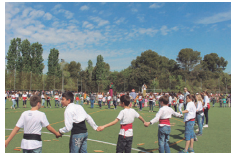
Dues imatges de la sardana amb tot l'alumnat de l'escola al camp de futbol, abril 2015