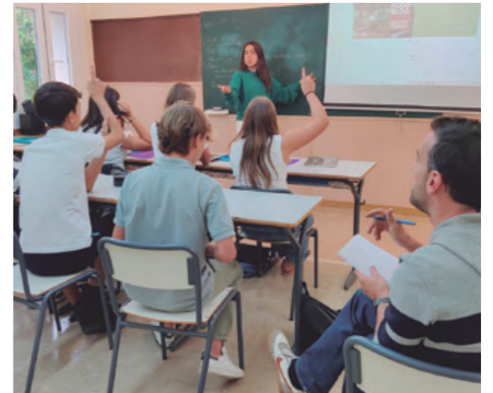
Coordinador observant una classe d'una professora novinguda, octubre 2023

durant tota la vida. Aprendre no ho fa només el nostre alumnat sinó que nosaltres, com a professors, també aprenem. El sistema d'observació de companys de CIC Idiomes es basa en la voluntat de millorar donant i rebent retroalimentació sobre el que passa a cada aula. Des de fa anys, les classes de tots els professors nous han estat observades per un coordinador durant el seu primer curs a CIC Idiomes. El que és més interessant és l'augment que s'observa en el nombre de professors del CIC que reben amb els braços oberts els seus col·legues en el seu «domini d'aula». És habitual sentir comentaris o rumors sobre el fet que alguns professors aconseguen que TOTS els seus alumnes parlin anglès TOTA l'estona o sobre professors que aconseguen que la lectura sigui una activitat divertida (cosa molt difícil d'aconseguir en aquesta era digital).